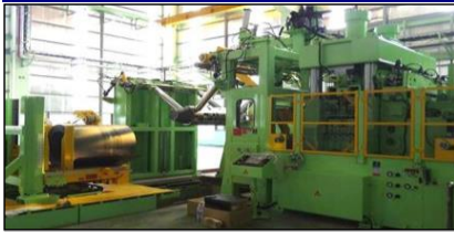
PRESS MACHINE-No.1 HP800ton