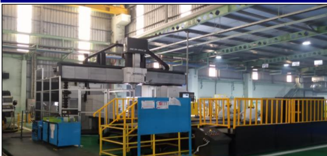
TABEL WORK SIZE = 2000X4000 (mm)